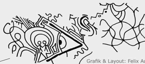
Grafik & Layout: Felix Autor