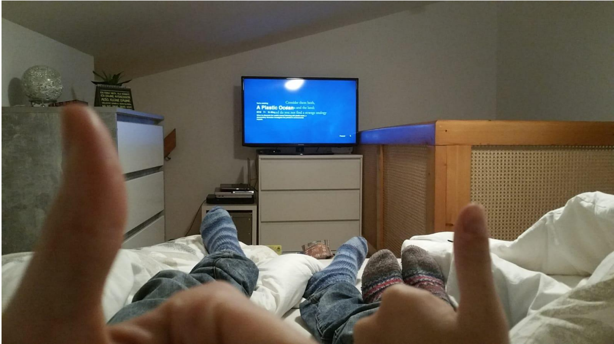
Dokumentation auf Netflix: A Plastic Ocean – kein angenehmer Filmabend, aber ein lehrreicher und eindrücklicher