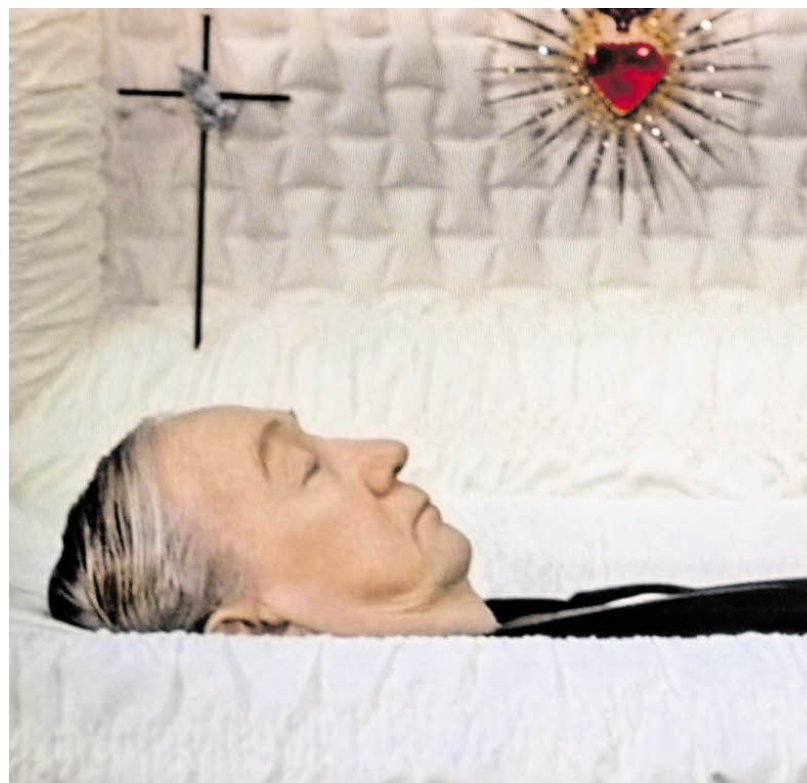
Puccini-Oper „Gianni Schicchi“ am Mozarteum.