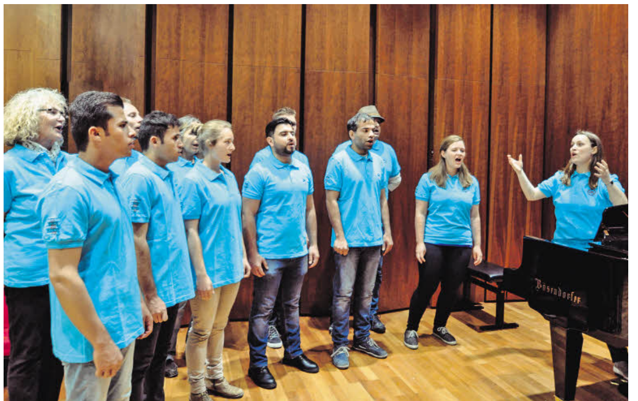
Der Chor „One Peace“ der ÖH Mozarteum für Studierende und Asylsuchende.