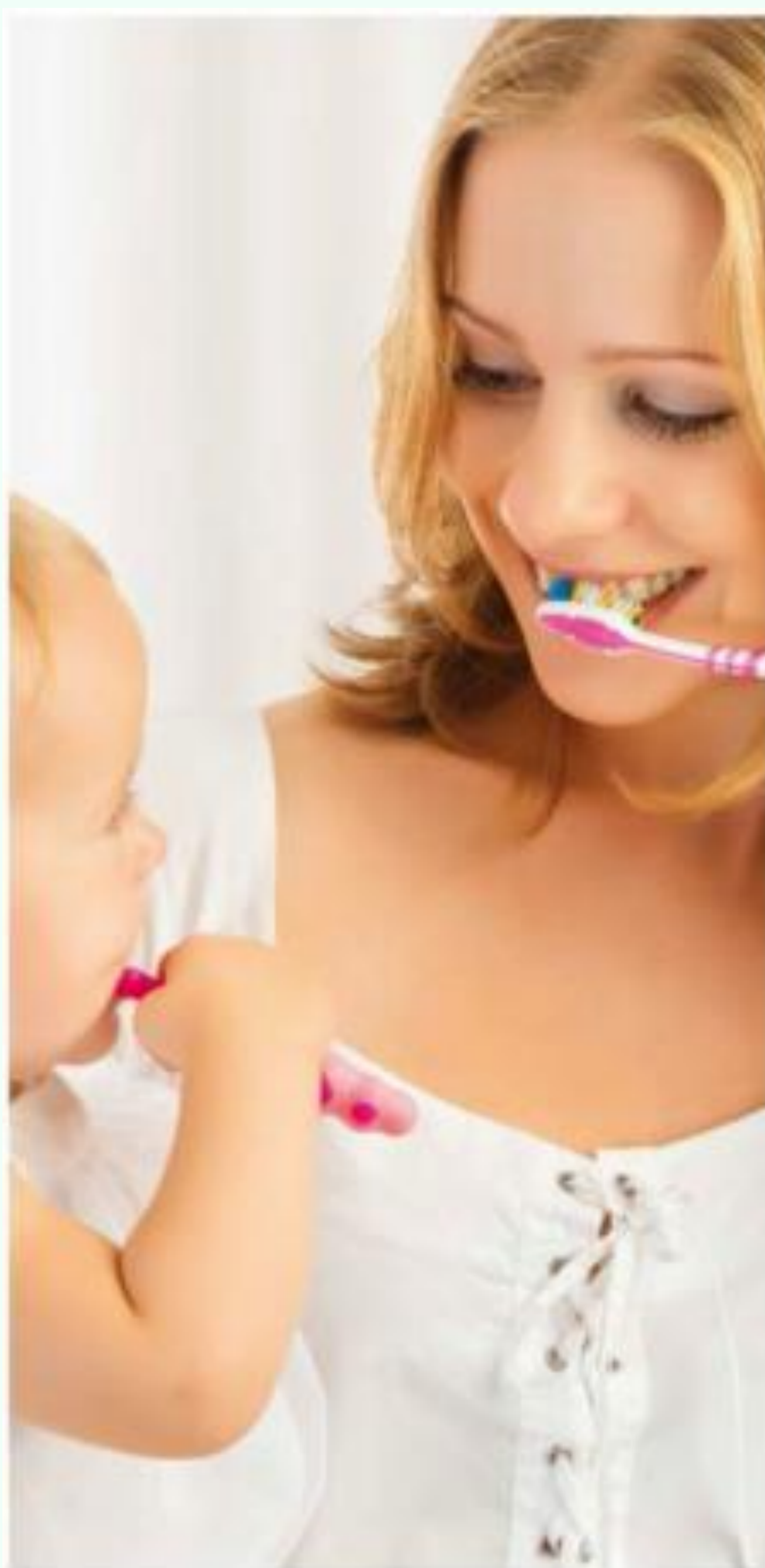
Mein Kind beginnt zu essen

Der Lehrendenleitfaden enthält generelle methodische Hinweise zur Arbeit mit authentischen Texten bzw. Fachwortschatz, Hinweise zur Abfolge und zum möglichen Einsatz der Aufgaben und Übungen, Hinweise für die Arbeit mit leistungsstärkeren oder -schwächeren Gruppen (Binnendifferenzierung) sowie Hinweise auf zusätzliche Materialien und Informationen.