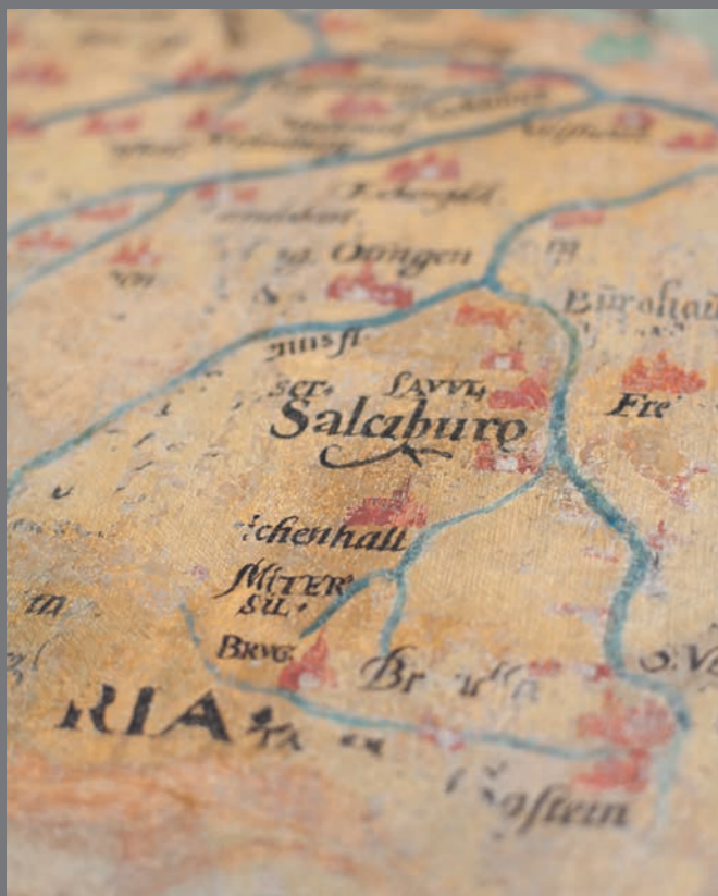
Landkartenausschnitt Germaniens mit der Darstellung von Salzburg ©Lepka