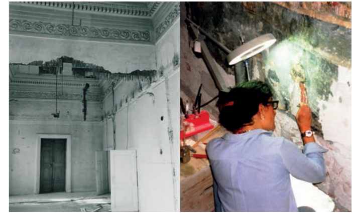
Zustand der Landkartengalerie vor und während der Restaurierung