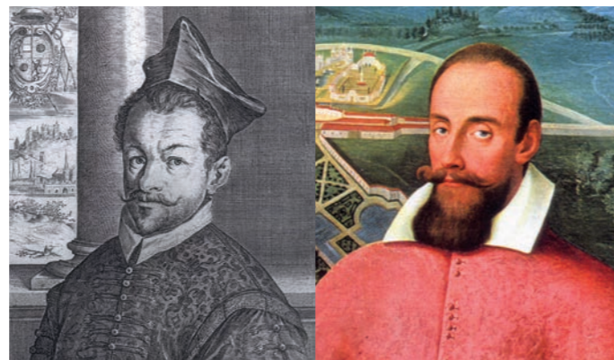
Wolf Dietrich von Raitenau

Geschworene Feinde waren die Bauherren der Landkartengalerie und doch einander nicht unähnlich! Weltgewandt und weitgereist kamen beide nach ihrem Studium in der „Ewigen Stadt“ nach Salzburg, aus dem sie ein „Rom des Nordens“ machen wollten. Die Residenz ließen sie als Sinnbild ihrer Macht erbauen: Als unumschränkte Fürsten wollten sie zwischen den Götterbildern der Antike und den Symbolen des Christentums herrschen, welche die Gegensätze in sich vereinen: „Himmel und Erde in einer Hand!“