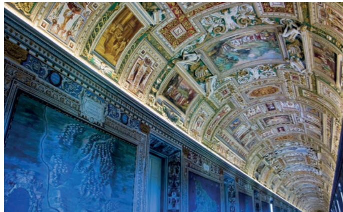
Galleria delle Carte Geografiche

Papst Pius IV., Großonkel von beiden Fürsterzbischofen, hatte die „Terza Loggia“ in seinen Privatgemächern mit Landkarten ausgestalten lassen. Genau in jener Zeit, als der junge Wolf Dietrich zur Ausbildung in Rom weilte, entstand die imposante „Galleria delle Carte Geografiche“ in den Vatikanischen Museen. Auf beeindruckenden 120 m Länge und 6 m Breite umrahmten an den Wänden vergoldeter Stuck und farbige Fresken mit Wappen, Allegorien und kleinen Figuren alle Regionen Italiens.