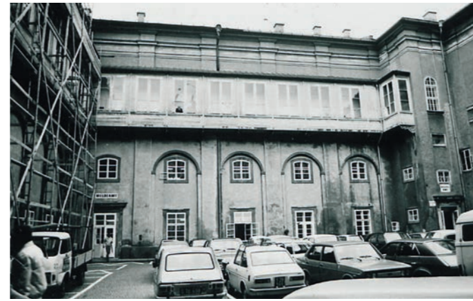
Holzgang an der Außenseite der Landkartengalerie

Unstet verlief die Geschichte der Landkartengalerie nach der Säkularisierung des Erzstiftes Salzburg 1803. Nach zahlreichen Umbauten „residierte“ hier ab 1922 die österreichische Bundespolizei. Der Saal wurde für kleinere Büros mehrfach unterteilt, Öfen wurden eingebaut, Rohre und Elektroleitungen verlegt, die Wände mehrmals mit weißer Farbe übertüncht und eine Zwischendecke eingezogen, um Heizkosten zu sparen. An der Hofseite führten mehrere Türen zu einer Holzgalerie. Nach und nach geriet die Landkartengalerie der Erzbischöfe in Vergessenheit.