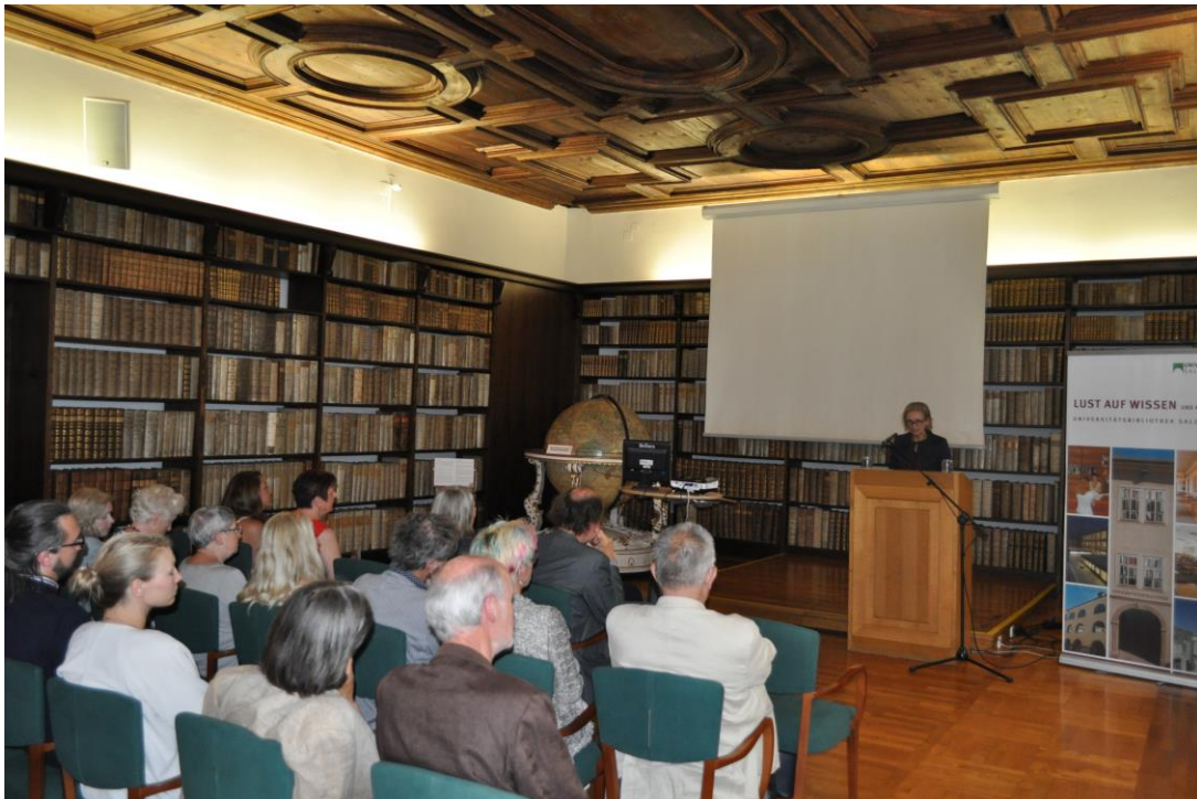
Die zahlreich erschienenen BesucherInnen bei der Eröffnung der Ausstellung in der historischen Bibliotheksaule der Universitätsbibliothek Salzburg.